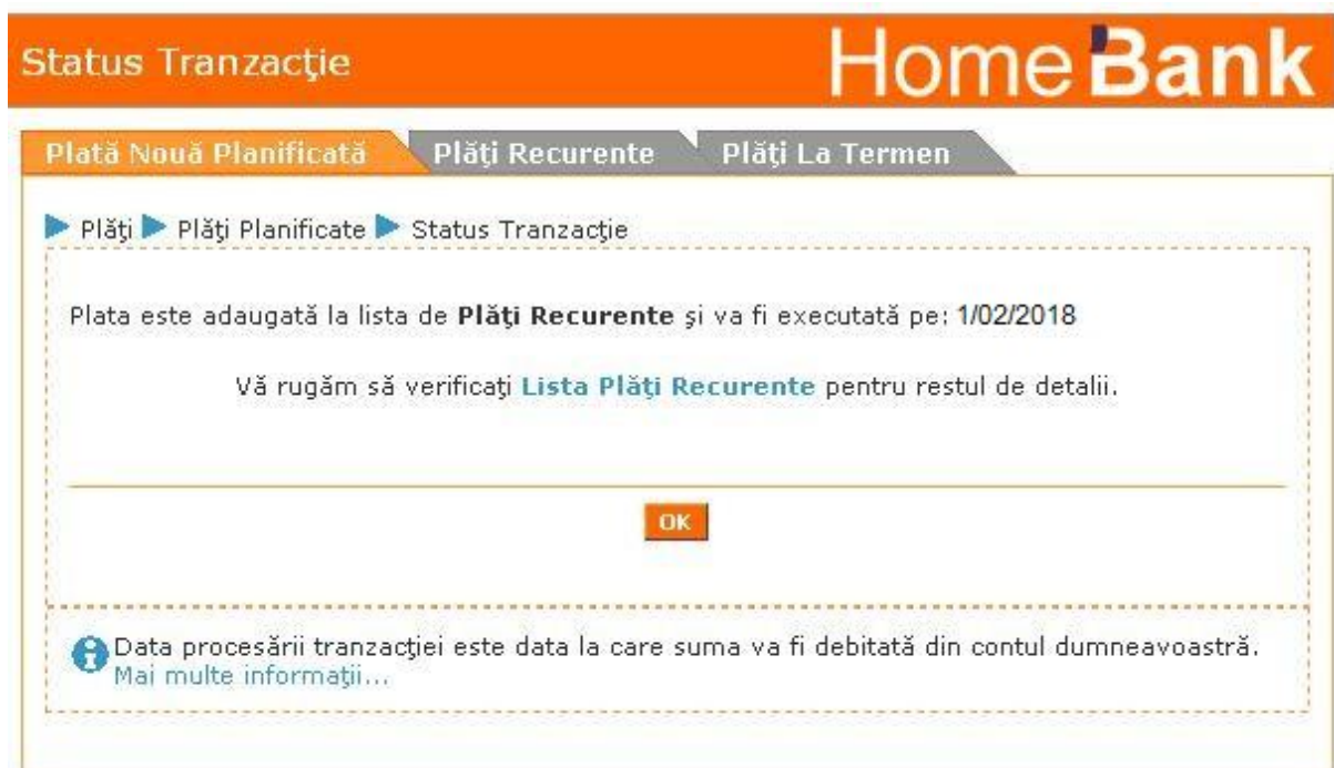
Figura 4.35 Status Plata Recurenta

Pentru a confirma plata si programa executia ei, introduceti codul generat de digipass si apasati butonul „ Confirma ”. Pagina urmatoare va fi afisata: